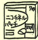
ニコチネルパッチ 20